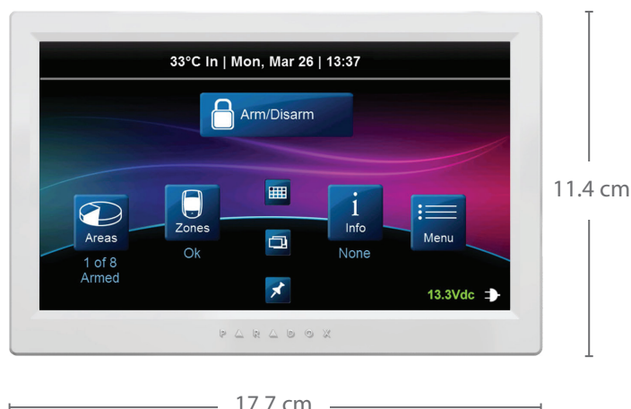
TM70: Πληκτρολόγιο Αφής